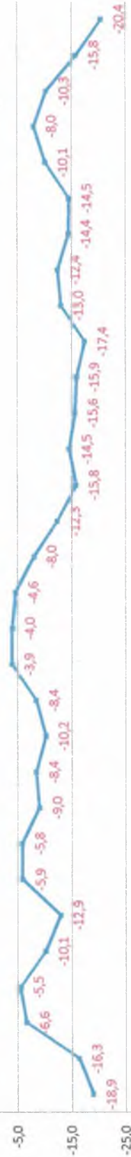
-11,3°C - средняя температура наружного воздуха за месяц